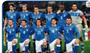
La nazionale di calcio

Da un altro angolo, angolo, angolo il mondo immobile, immobile, immobile diventa mobile, mobile, mobile e tutto scivola.