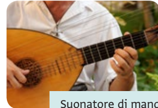
Suonatore di mandolino

Italiani: calcio e mandolino , ————— Fellini disegna sul taccuino il Toro sfida il Cavallino ————— IL TORO è il simbolo della Lamborghini, Il CAVALLINO quello della Ferrari Benigni, Bolle, Renzo Piano ————— io mangio piano con Slow Food