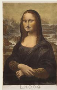
Marcel Duchamp, L.H.O.O.Q. , 1919, Philadelphia Museum of Art.

Lis cette phrase tirée de la vidéo : « ... sa cuisine et ses ateliers ... ». Les adjectifs possessifs indiquent que le nom suivant a un lien avec une personne. N'oublie pas l'accord : • au singulier : mon, ton, son, ma, ta, sa, notre, votre, leur ; • au pluriel : mes, tes, ses, nos, vos, leurs .