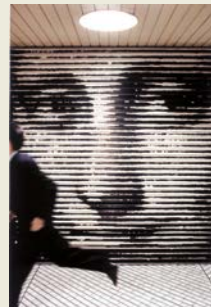
Une station de la métro à Tokyo, au Japon.