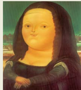
Fernando Botero, Mona Lisa , 1978, Museo Botero, Bogotá.