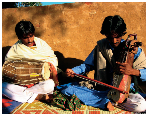
India: due giovani musicisti di strada suonano un tamburo e un sarangi, antico strumento a corde simile al violino.

Nell'antica Roma la musica viene eseguita soprattutto in piazze, ....., teatri all'aperto, e ..... il culto ....., la danza, il lavoro e la vita militare.