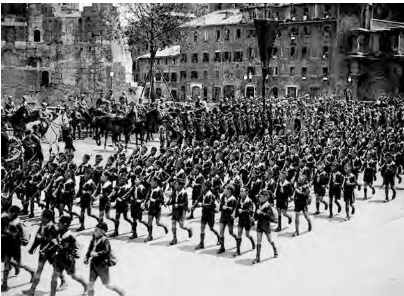
PARATA MILITARE DI GIOVANI BALILLA A ROMA.