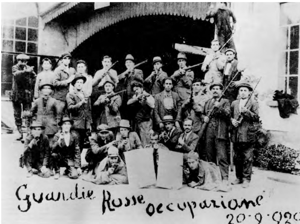
ALCUNI OPERAI OCCUPANO UNA FABBRICA, 2 SETTEMBRE 1920, FOTOGRAFIA IN BIANCO E NERO.