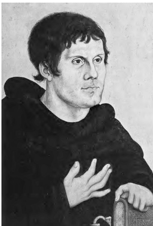
LUCAS CRANACH IL VECCHIO, RITRATTO DI MARTIN LUTERO GIOVANE, 1526, OLIO SU TELA (NORIMBERGA, GERMANISCHES NATIONALMUSEUM).